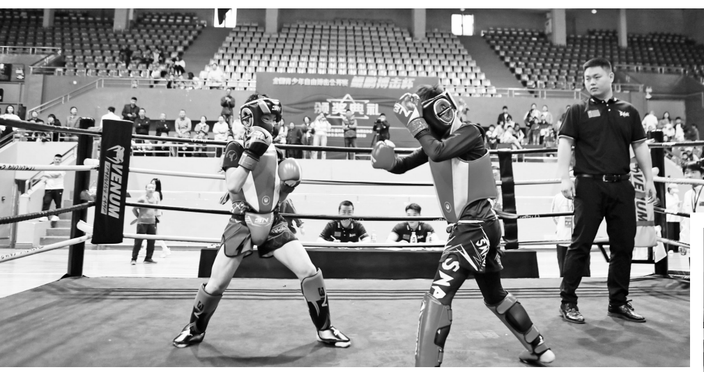
▲5月2日,全国青少年自由搏击公开赛“鲲鹏搏击杯”在重庆市永川区棠城体育馆开赛,来自云南、贵州、四川、重庆等省市的18支代表队200余名6—18岁运动员参赛。比赛旨在推进全民健身搏击运动,提高青少年健身防身意识和习武热情。

康震指出,北京师范大学将在教育领域各方面同陕西加强沟通、深入交流、达成合作,共同推进师范生的职业规划、就业保障支持和职后培训工作。何玉麒强调,要高度重视第一批“优师计划”毕业生的实习、就业工作保障,合理优化布局、分层安排实施;研究制定就业方案,确保师范生就业覆盖省内定向县;加强与北京师范大学的交流合作,全力推动“优师计划”工作落实落地。