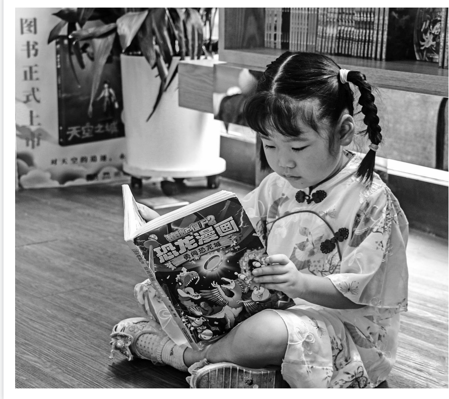
随手拍 · 悦读

我想,我也应该在专业阅读和专业写作上做出自己的一点努力,用写作这种输出方式,作为知行合一的重要途径,在写作的过程中,成就一个不一样的我。